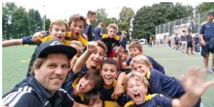
„Selfie“ der D1 Jugend nach dem Pokalsieg

Wir möchten uns an dieser Stelle nochmal bei allen Helfern und Kuchen Spendern bedanken, ohne die eine solche Veranstaltung nicht möglich gewesen wäre. Wir sind uns sicher, das bei der nächsten Saisoneröffnung die Standdienste noch Verantwortungsvoller besetzt werden, damit wir einen noch reibungsloseren Ablauf hinbekommen und niemand mehr doppelten Dienst schieben muss.