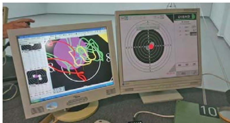
Mit einer besonderen Trainingseinrichtung werden nicht nur die Treffer angezeigt (rechter Bildschirm), sondern auch die Bewegung des Schützen in der Zielphase (linker Bildschirm)