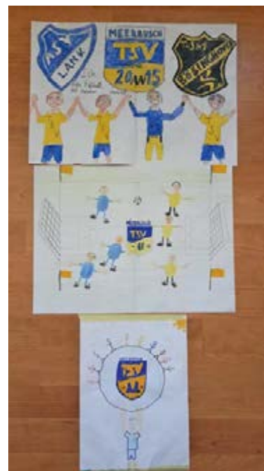
Die Siegerbilder Plätze 1 - 3