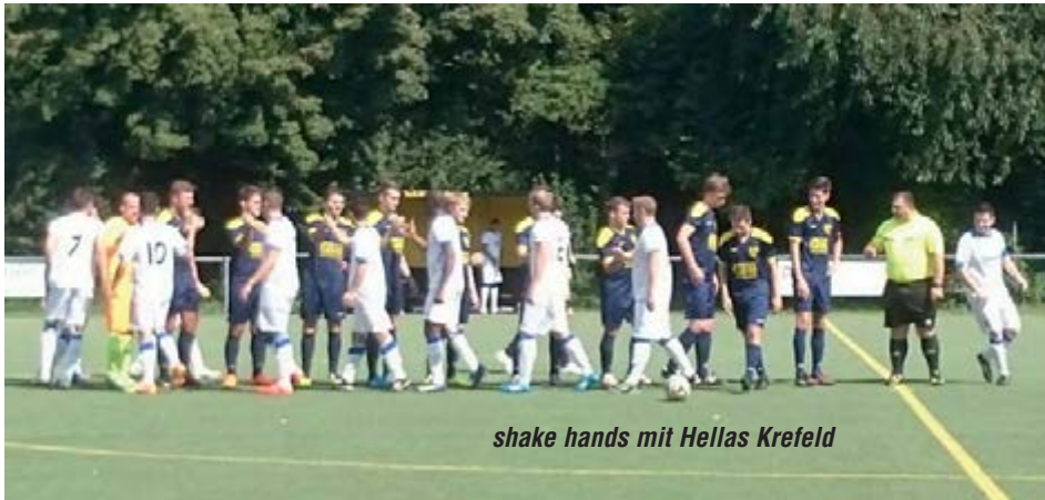
shake hands mit Hellas Krefeld