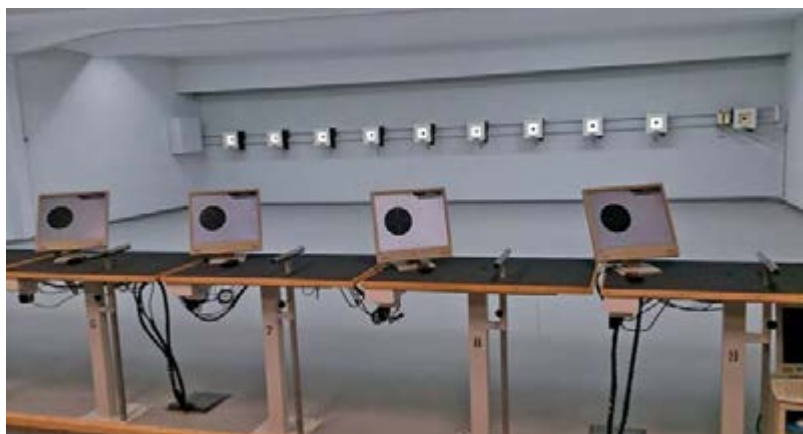
Blick in die Schießsportanlage, jetzt ausgerüstet mit vollelektronischen Ziel-Messsystemen; die Treffer werden dem Schützen individuell auf dem Computerbildschirm angezeigt.

Frank Tovornik Abteilungsgeschäftsführer