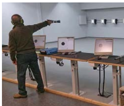
Ein Sportschütze in der Disziplin Luftpistole; Ergebnisverfolgung auf dem Bildschirm