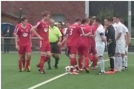
shake hands in Strümp

Ersten von Strümp (Bezirksliga), von wo sie auch kamen. Aber es war ein gutes Lehrstück für unsere jungen Spieler. Das zweite Spiel, gegen Hellas Krefeld, ging nur knapp mit 0:1 verloren. Nach dem Tor (57. Minute) mauerte Hellas seinen Strafraum zu und auch das war äußerst lehrreich für unsere junge Mannschaft.