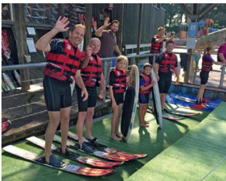
Warten auf die Startfreigabe für unsere tollkühnen Skisportler.